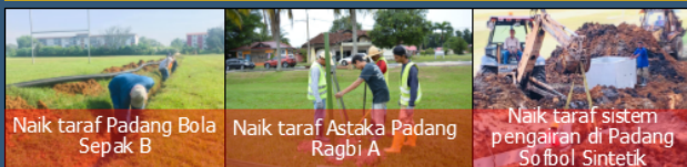
Naik taraf Padang Bola Sepak B